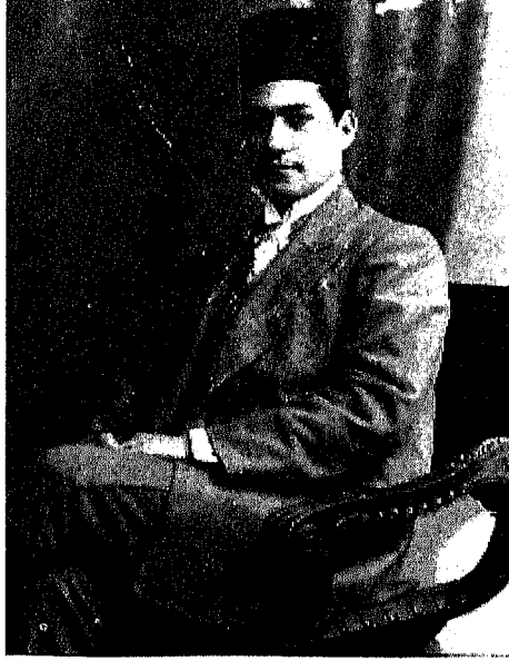
سعید زغلول .. أول قصة حب في حياة نازلي ..